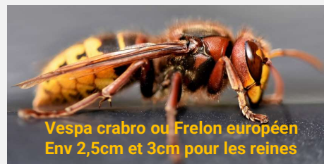
Vespa crabro ou Frelon européen Env 2,5cm et 3cm pour les reines